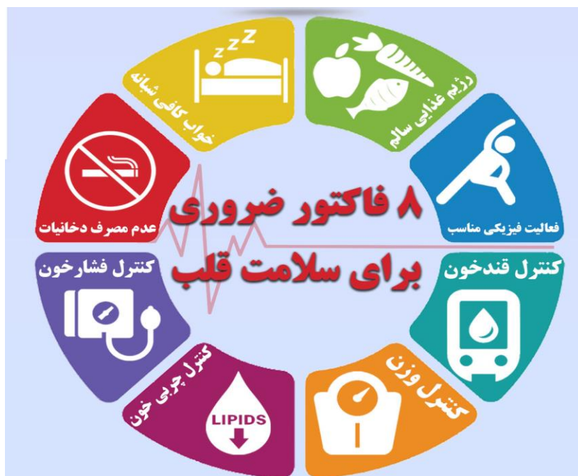
تصویر ۱- هشت فاکتور ضروری برای سلامت قلب