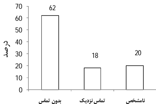
نمودار 2- سابقه تماس با بستگان نزدیک مبتلا به سل

DNA template و بقیه حجم آب مقطر به وسیله PCR بسط داده شدند. پارامترهای تکثیر 1 شامل تقلیب اولیه در 95 درجه سانتی‌گراد برای 5 دقیقه است که به دنبال آن 40 سیکل، هر یک شامل تقلیب در 95 درجه سانتی‌گراد برای 30 ثانیه، اتصال در 56 درجه سانتی‌گراد به مدت 30 ثانیه و طول‌سازی در 72 درجه سانتی‌گراد برای 45 ثانیه انجام می‌شود. جهت تکثیر از دستگاه ترموسایکلر گرادیان (Touchgene, Gradient) استفاده گردید. محصولات بسط‌یافته نهایی با استفاده از الکتروفورز ژل (Padideh Nojan Pars, Iran) (به وسیله ژل آگاروز 1/5% و اتیدیوم بروماید (Sigma)) شناسایی شدند.