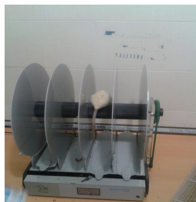
شکل 1- دستگاه استوانه چرخان (Rotarod) برای بررسی فعالیت حرکتی حیوانات

ثبت فعالیت های حرکتی و تعادلی حیوان (Rotarod accelerating): برای بررسی فعالیت های تعادلی و قدرت هماهنگی حرکتی بین اندام ها، از دستگاه TSE Rotarod System استفاده شد. برای ارزیابی فعالیت تعادلی توسط این دستگاه، حیوان روی میله افقی چرخنده به قطر 3 سانتی متر در حال چرخش با سرعت اولیه 10 دور در دقیقه قرار گرفت. سرعت نهایی، از 10 به 20 دور در دقیقه در طی مدت زمان 20 ثانیه افزایش داده شد. زمان حفظ تعادل و باقی ماندن روی میله، برای هر حیوان ثبت شد. بعد از القای پارکینسون، ابتدا به هر حیوان دوبار فرصت برای عادت کردن و تطابق با دستگاه داده شد (معیار یادگیری، باقی ماندن به مدت 5 دقیقه روی میله می باشد)؛ سپس سه بار دیگر حیوان روی دستگاه قرار گرفته و میانگین زمان به دست آمده محاسبه شد. بعد از هر بار قراردادن حیوان روی دستگاه، به مدت 30 دقیقه به حیوان استراحت داده و سپس فعالیت تعادلی دوباره اندازه گیری شد (18) (شکل 1).