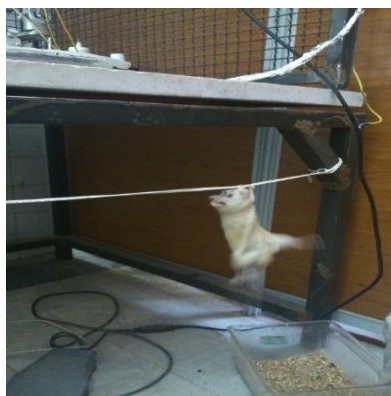
شکل 2- روش انجام آزمایش آویزان ماندن (Hanging or wire grasping test)

آزمایش بررسی قدرت عضلانی و تعادل (Hanging or wire grasping test): هر موش توسط پاهای جلویی خود، از یک سیم فلزی (80 سانتی متر طول و 7 میلی متر قطر) آویزان شد. هنگامی که حیوان به سیم فلزی چنگ می زد، آن را رها کرده و مدت زمان تأخیر در سقوط حیوان توسط کروномتر ثبت شد. موش ها به صورت تصادفی انتخاب شدند و برای هر موش، سه بار این آزمایش انجام شد. بین هر مرحله آزمایش، 30 دقیقه به حیوان استراحت داده شد (18) (شکل 2).