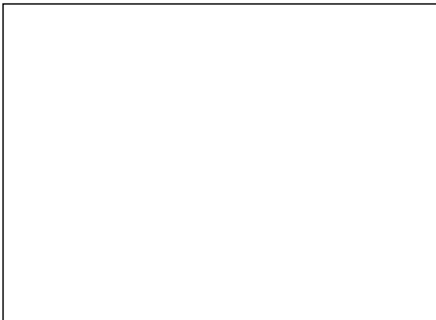
نمودار ۱- میانگین LDL اکسیده شده گروههای شرکت کننده در مراحل مختلف تحقیق

آزمون و پیش آزمون با پس آزمون) اتفاق می افتند. علاوه بر این، میزان نمایه توده بدنی (BMI) نیز پس از تمرینات هوازی شدید کاهش معنی داری یافت که نشانه تغییر مطلوب (کاهش) میزان چربی بدن پس از فعالیتهای هوازی با شدت بالا می باشد (جدول ۲)؛ از طرف دیگر افزایش معنی داری در حداکثر اکسیژن مصرفی (VO2max) شرکت کنندگان در تمرینات هوازی شدید (۴۲/۷۸±۴/۹۰) در برابر (۵۰/۸۰±۶/۷۷) و تمرینات هوازی متوسط (۳۷/۹۰±۵/۳۲) در برابر (۴۳/۸۸±۶/۱۷) پس از تمرین مشاهده شد؛ در حالی که شاخص فوق در گروه شاهد در طی دوره زمانی مشابه، بدون تغییر معنی دار (۴۱/۲۱±۵/۸۸) در برابر (۴۲/۹۸±۵/۸۷) باقی ماند.