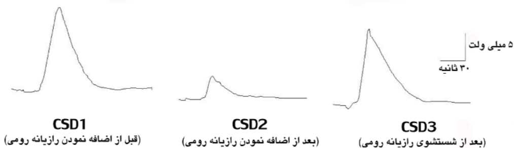
( الف )