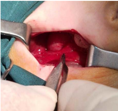
شکل ۳- باندهای چسبنده دور پیلور و دئودنوم مشخص است.