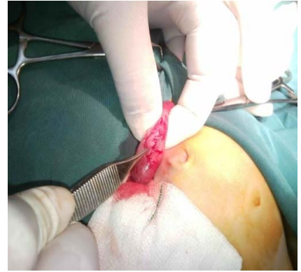
شکل ۱- تنگی هایپرتروفیک پیلور مشخص است.

خانوادگی، روده باریک کوتاه و بد حرکتی ۱ دارند (۲۱). بروز تریزومی ۲۱ (بیماری داون) در نوزادان با تنگی هایپرتروفیک پیلور مشابه بروز آن در جمعیت عمومی (حدود ۱ در ۷۰۰ تواد زنده) است (۱۶)؛ در حالی که در بیماران مبتلا به نشانگان داون، بروز ناهنجاری‌های دستگاه گوارش از قبیل آترزی دئودنوم، پانکراس حلقوی، فیستول نای- مری، پرده دئودنوم و بیماری هیرشپرونک شایع است (۱۶). هرچند توسط Kao و همکاران، همراهی پرده دئودنوم با تنگی هایپرتروفیک پیلور در یک بیمار سندرم داون گزارش شده است (۲۲)، نکته مهم در بیمار گزارش شده در مقاله حاضر، همراهی تنگی هایپرتروفیک پیلور با پانکراس حلقوی در یک بیمار مبتلا به نشانگان داون است که تاکنون گزارش نشده است. پانکراس حلقوی یک ناهنجاری مادرزادی است که ۱٪ همه انسدادهای روده‌ای در کودکان را شامل می‌شود (۲۳) و حدود ۵۰٪ موارد این بیماری با سایر ناهنجاری‌های مادرزادی از قبیل بیماری داون (۳۰٪)، فیستول نای به مری، آترزی مری، مقعد سوراخ نشده و بیماری هیرشپرونک همراهی دارد (۲۴، ۲۵).