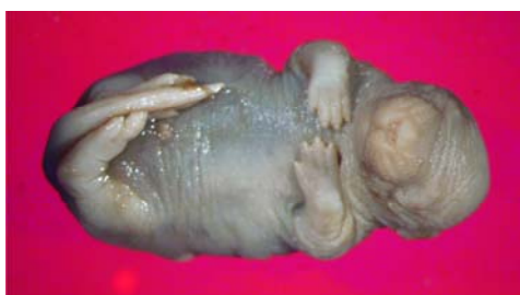
شکل ۳- نمونه جنین در گروه تجربی II با بدشکلی (دفرمیتی) اندامهای فوقانی و تحتانی و کل بدن