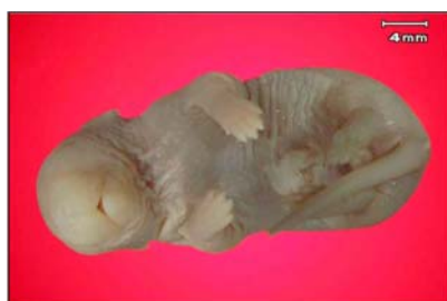
شکل ۴- نمونه جنین در گروه تجربی II با کوتاهی دست راست و بدشکلی (دفرمیتی) پای چپ