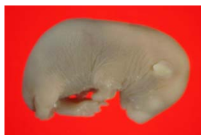
شکل ۱- نمونه جنین در گروه تجربی I با بدشکلی (دفرمیتی) اندامهای فوقانی و تحتانی