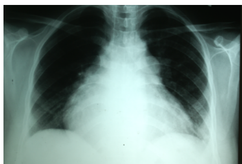
شکل ۲- رادیوگرافی قفسه سینه: تصویر رادیوگرافی، بزرگی اندازه قلب را نشان می‌دهد.