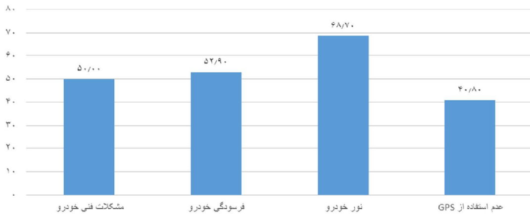
نمودار ۳- درصد فراوانی عوامل فنی و خودرو دخیل در بروز حوادث جاده‌ای از دیدگاه رانندگان تاکسی‌های بین‌شهری کرمان در سال‌های ۹۴-۱۳۹۲