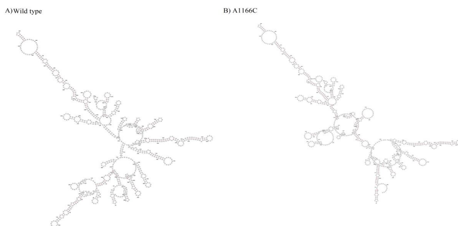
شکل 2. تأثیر پلی مورفیسم A1166C ژن AGTR1 بر خمش انتهای 3' RNA. الف) ساختار 3'-UTR نرمال. ب) ساختار 3'-UTR موتانت.

همچنین بررسی تأثیر این پلی مورفیسم بر ساختار انتهای mRNA 3' خمش اشتباه را نشان داد (شکل 2). در این