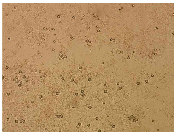
شکل 2- تروفوزوئیت‌های جنس آکانتاموبا در محیط کشت آگار غیرمغذی غنی شده با اشرشیا کلی