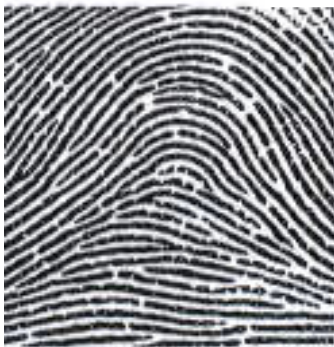
شکل ۱- سه الگوی اصلی اثر انگشت دست (الف) مارپیچی، (ب) حلقوی، (ج) کمائی