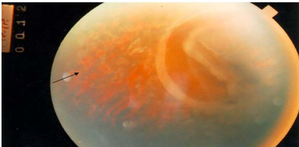
شکل ۲- اسکار نقاط لیزر شده و چسبیدگی شبکیه (نشانگر)

بهترین حدت بینایی تصحیح‌شده، در چشم راست 20/80 و در چشم چپ 20/20 بود. ارزیابی سگمان قدامی، در هر دو چشم طبیعی بود. یافته‌های معاینه ته چشم، خونریزی داخل ویتره و جداشدگی ساب‌کلینیکال شبکیه، در ربع سوپرانازال شبکیه چشم راست را نشان داد. دژنراسیون کیستیک خفیف در اطراف شبکیه هر دو چشم نیز مشاهده شد. فتوکواگولاسیون شبکیه، با استفاده از لیزر دیود، در اطراف پارگی شبکیه انجام شد (شکل یک). بعد از یک ماه از فتوکواگولاسیون با لیزر دیود، جداشدگی ساب‌کلینیکال شبکیه و خونریزی داخل زجاجیه برطرف شد (شکل ۲) اما حدت بینایی به خاطر چین‌خوردگی ماکولا، به میزان 3/200 کاهش پیدا کرد (شکل ۳).