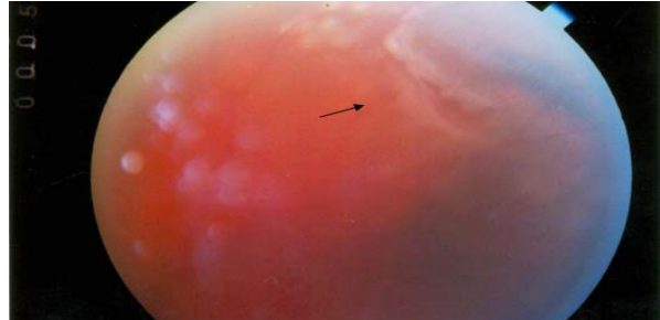
شکل ۱- کدورت در شفافیت محیط زجاجیه (خونریزی زجاجیه)، پارگی شبکیه، نقاط لیزر شده (نشانگر)